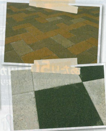
▲ブロック各種1㎡6,000円(税込)~ ※工事費は含まれていません